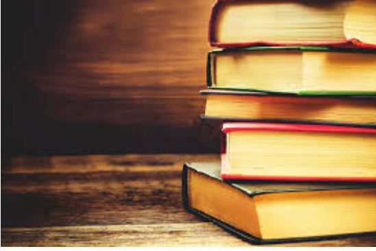
• Salat Nedir 2 - Bakara 43-45