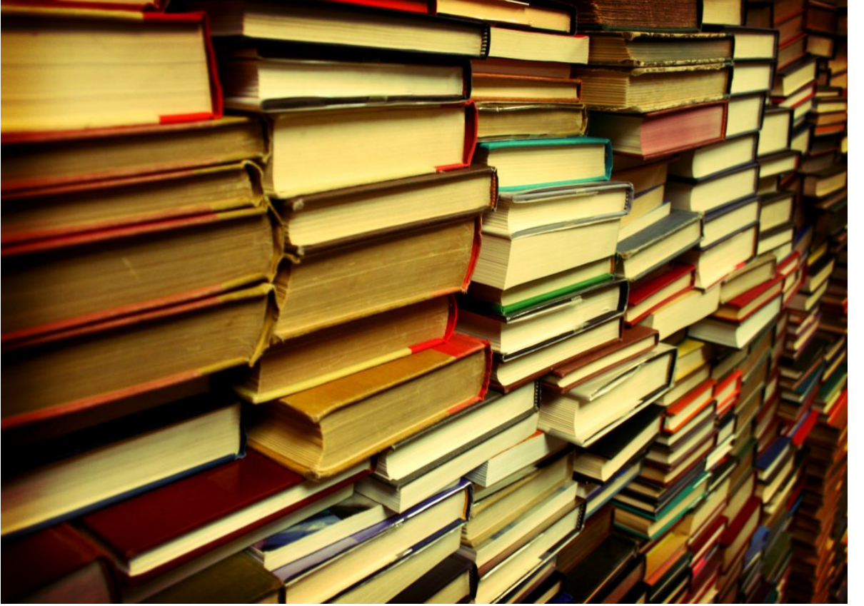
• Salat nedir? -Giriş-